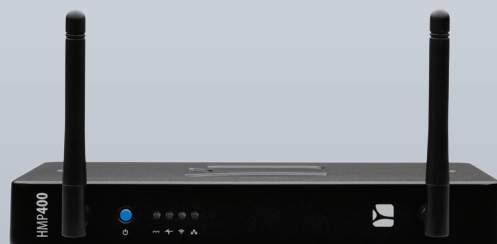
HMP400W mit wifi